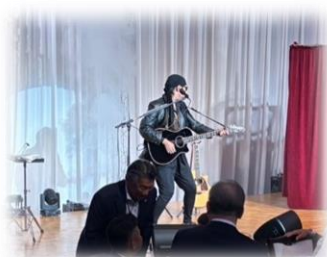
▲晩餐会 アトラクション