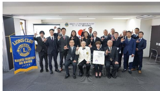
▲チャーターメンバー