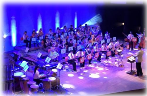
▲式典アトラクション 【中部大学春日丘高校 吹奏楽部】