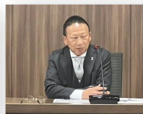
▲ 講師 2 名の方々