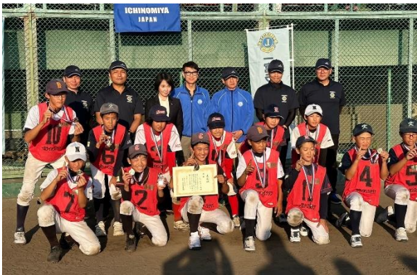
優勝 レッドチーム

快晴の中、一宮平島公園野球場にて、一宮市オールスター選抜学童野球祭が、主催 一宮ライオンズクラブ、後援 一宮軟式野球連盟、一宮市、一宮市教育委員会、一宮市スポーツ協会、中日新聞社、株式会社アイ・シー・シー、FMいちのみや株式会社により開催されました。