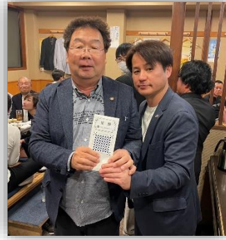
2LC合同親睦ゴルフ大会