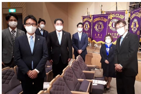
▲今年 7 月に一宮 LC に入会された新会員の方々