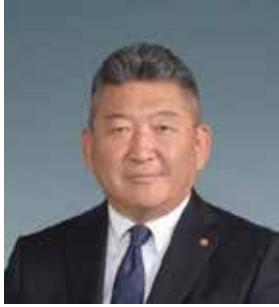
第1副地区ガバナー