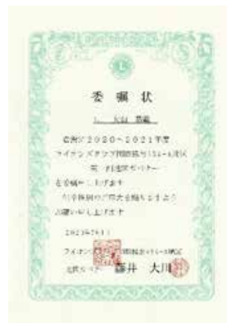
▲ 第1副地区ガバナー L 大山恭範