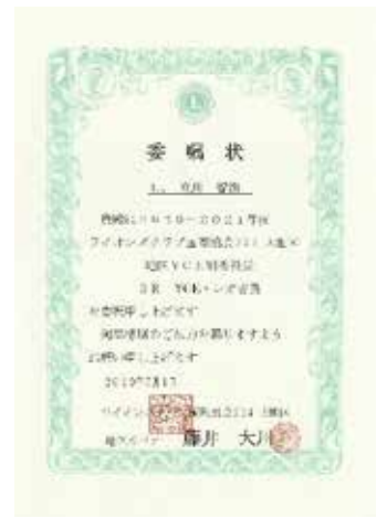
▲ 3RYCE レオ委員 L 立川智浩