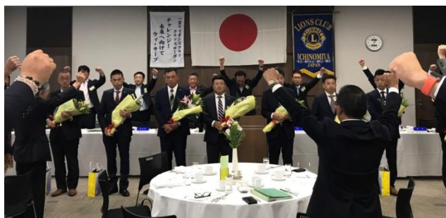
▲7月10日に入会式をされた9名の方々