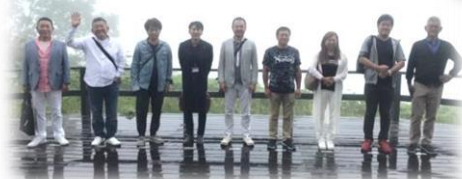
▲2008年サミットが開催されたザ・ウィンザーホテル洞爺リゾートにて