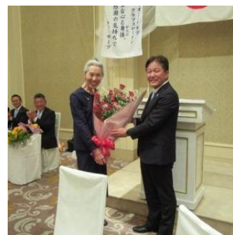
▲リジョン役員、ご苦労様でした。