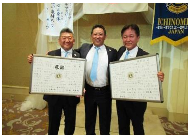
▲サプライズに感激！！