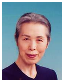
3R家族及び女性チーム (FWT) 委員